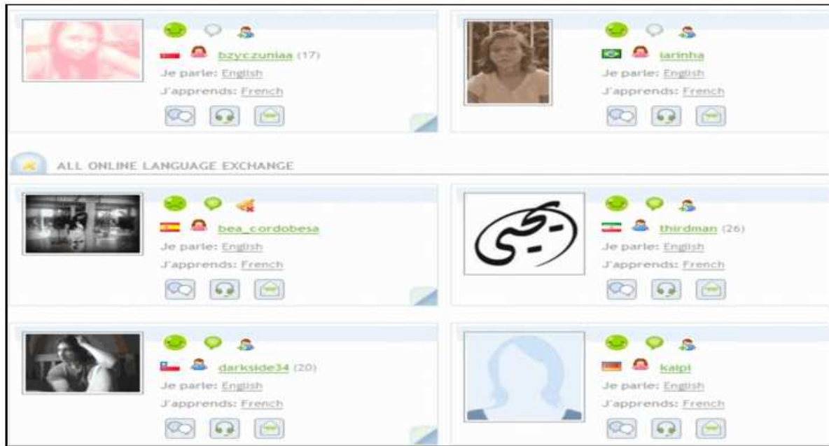
Figure 1 - Page de plusieurs identités numériques dans Palabéa.

maîtrise et la langue qu'il souhaite apprendre. L'identité numérique calculée offre la possibilité de convoquer des amis qui sont des personnes déjà inscrites sur la plateforme. Enfin, elle est agissante dans le sens où l'utilisateur peut publier par exemple des commentaires sur une ressource déposée par un autre utilisateur.